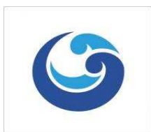
Επαγγελματικός Σύλλογος Γαλαξειδίου